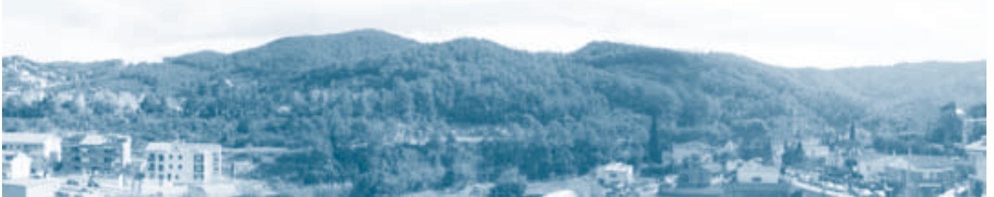
Terrenys entre Mas Segarra i Catalunya en Miniatura que el 1995 es van preservar de ser urbanitzats

Estem en contra del Pla Parcial de Can Balasch per diverses raons però, sobretot, perquè la proposta no significa la creació d'un barri racional i sostenible i perquè significa renunciar incomprensiblement a habitatge assequible quan ara es pot fer, al servei de la gent de Torrelles.